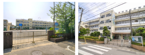
■加平小学校240m(徒歩3分) ■東島根中学校560m(徒歩7分)

月々のお支払いの目安は 頭金0円 ボーナス0円 6万7,436円 当社提携銀行利用 金利0.775% 35年ローン銀行審査による