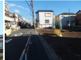
■全面道路を含む現地写真